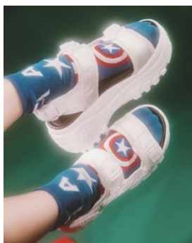
Doll Kiss 3P¥1,000（税抜き）