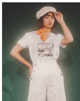
CECIL McBEE ¥2,900（税抜き）