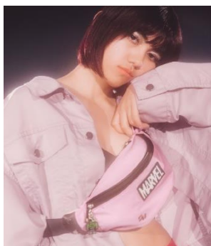
Samantha Vega ¥12,800（税抜き）

参加ブランド：Samantha Vega（1階）／CECIL McBEE（2階）／Doll Kiss（3階）／EMODA（3階）／ EGOIST（5階）／GYDA（5階）／SPIRALGIRL（5階）／Roger&Raw（6階）／ NICORON（7階）