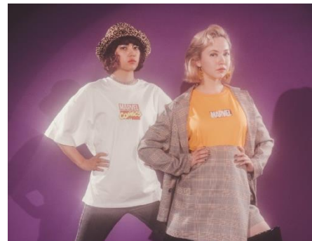
NiCORON （左）¥4,300（税抜き） （右）¥4,500（税抜き）