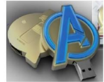
USBメモリストイック